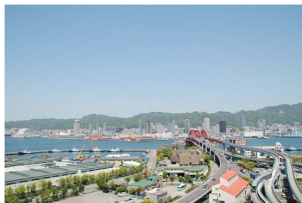
貸室からの眺望。ビルの北側には神戸港から市街地、さらに六甲連山が広がる