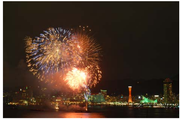
神戸の夏を彩る「みなとこうべ海上花火大会」 (ポートアイランドビルから撮影 例年8月第1土曜日)