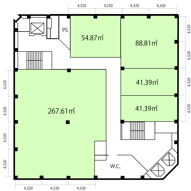
■ 4階～11階貸室 標準間仕切 494.07m 2